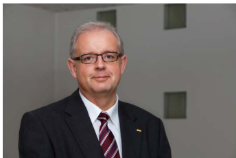
Ihr Ansprechpartner für das Upgrade

Bleiben Sie dem Wettbewerb einen Schritt voraus - mit Mahlo!